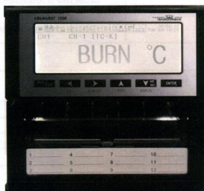
Рисунок 1 – Общий вид прибора Альфалог 100К

Общий вид приборов представлен на рисунке 1.